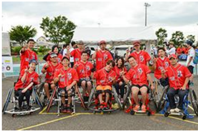
準優勝 TOKYO LEGEND FELLOWS