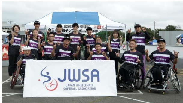
準優勝 茨城アストロプラネッツ