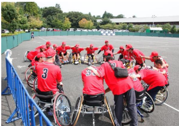
準優勝 TOKYO LEGEND FELLOWS