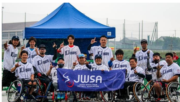
3位 埼玉A.S.ライオンズ