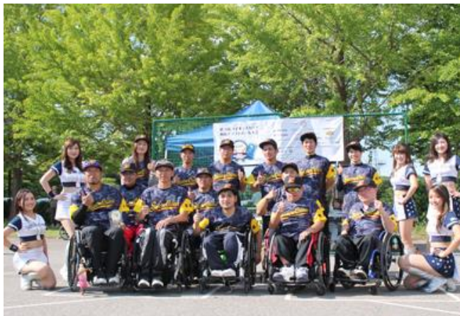
5位 群馬 Shadow Cranes