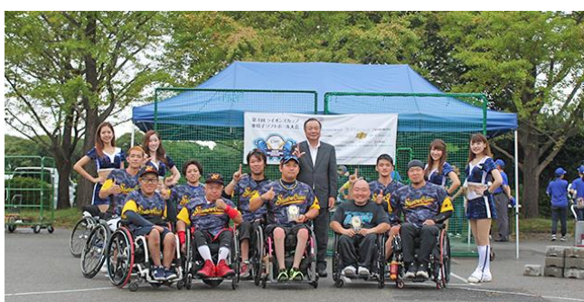
4位 群馬 Shadow Cranes