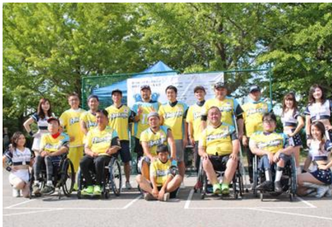
4位 HOKKAIDO AMBITIOUS