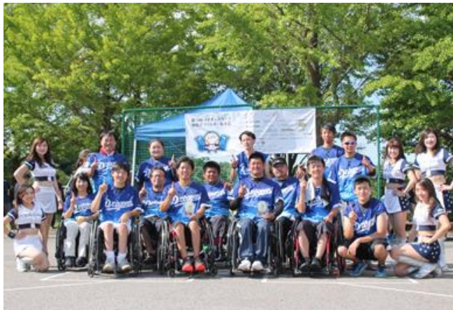
3位 東海UNITED DRAGONS