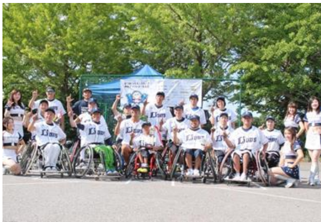
優勝 埼玉A.S.ライオンズ