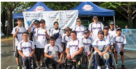
9位(同率) 茨城アストロプラネッツ