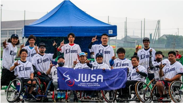
3位 埼玉A.S.ライオンズ