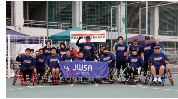
8位 琉球ワイルドキャッツ