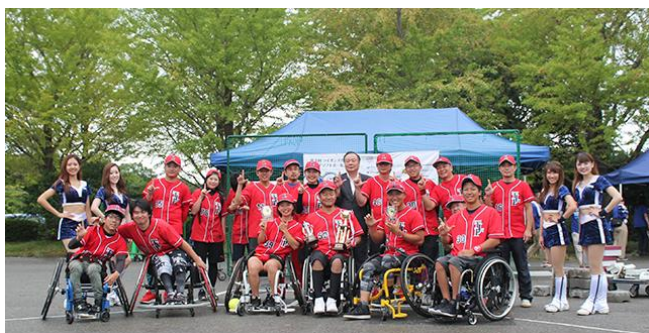
優勝 TOKYO LEGEND FELLOWS