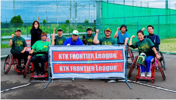
9位(同率) 宮城ファイティングスピリッツ