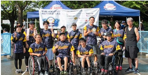
3位(同率) 群馬 Shadow Cranes