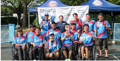
優勝 東海UNITED DRAGONS