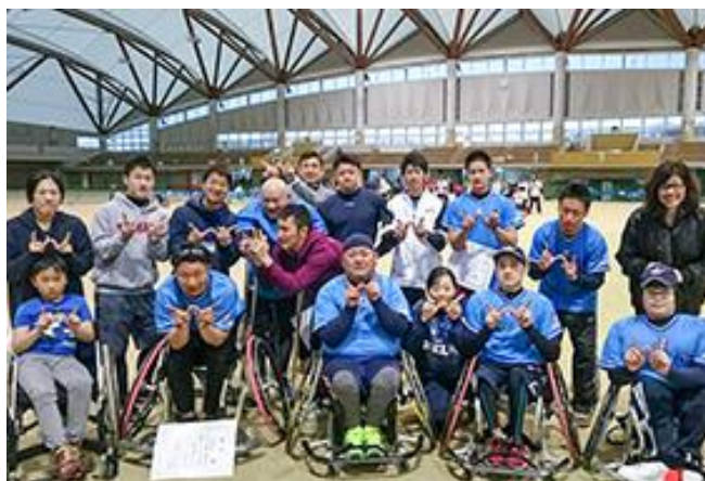
3位 ノースランドウォリアーズ