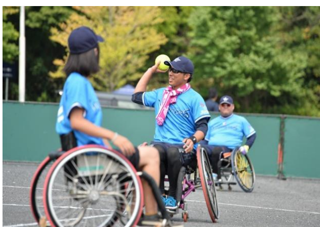
3位 ノースランドウォリアーズ