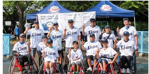
4位(同率) 埼玉A.S.ライオンズ