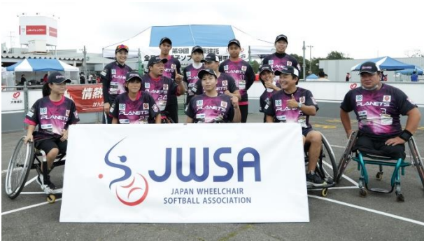
7位 茨城アストロプラネッツ