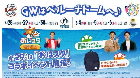
ファミリーフェスタ