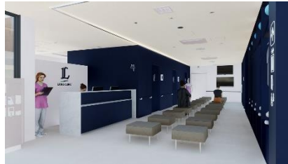
ライオンズ整形外科クリニック 1階 待合室 イメージ