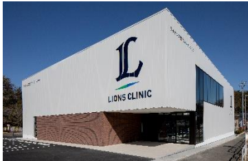
ライオンズ整形外科クリニック 外観