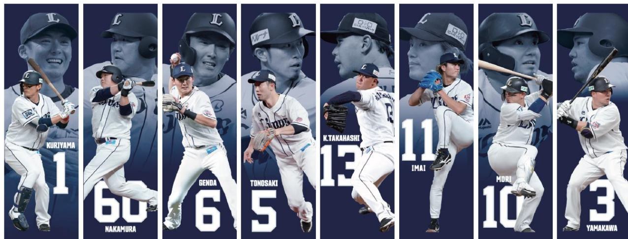
主力選手デザインイメージ