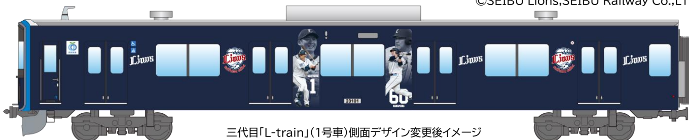
三代目「L-train」(1号車)側面デザイン変更後イメージ