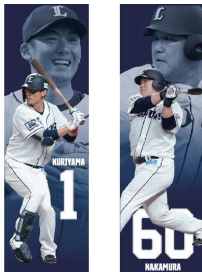
主力選手デザインイメージ