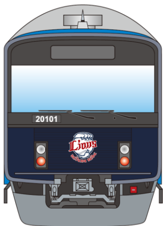
三代目「L-train」前面デザインイメージ