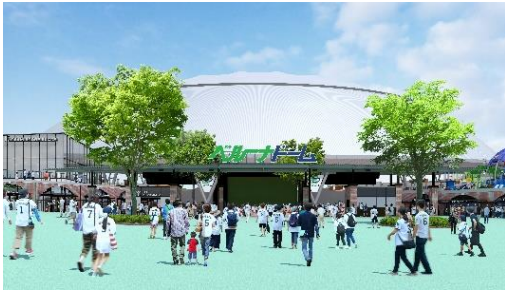
ベルーナドーム外観 イメージ