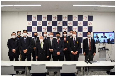
埼玉県野球協議会加盟団体